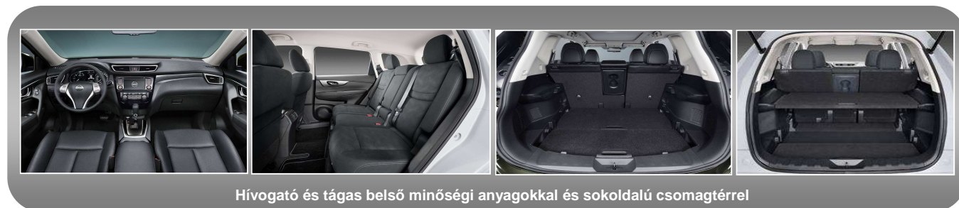
Hívogató és tágas belső minőségi anyagokkal és sokoldalú csomagtérrrel