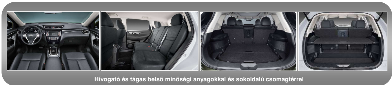
Hívogató és tágas belső minőségi anyagokkal és sokoldalú csomagtérrrel